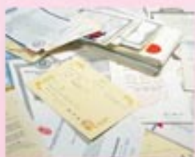
世界各國に展開する各種製剤

私たち東洋薬品工業は、世界各国に 医薬品外資館を中心とした数多くの製剤特許を所有しており、 関連会社(東洋インターナショナル)を通して技術を提供しています。 現在、生産されている製品の多くは、私たちの独創的な発想のもとに、 国内有数の大手製薬企業と共同で研究・開発したものです。 したがって、技術水準は国内トップレベルで、 特に、異性内伐り製剤などでは世界の製薬会社からも注目を集めています。 医薬品メーカーとしては、きわめて特徴的な 技術志向の会社といえるでしょう。